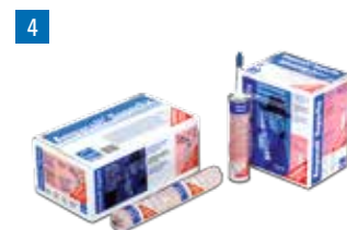
Ampacoll® Superfix: Colle liquide